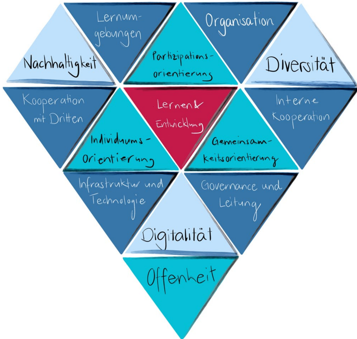
Abbildung 1: Diamantmodell für gute Schulen; Schäfer Martin/Michael Eckhart